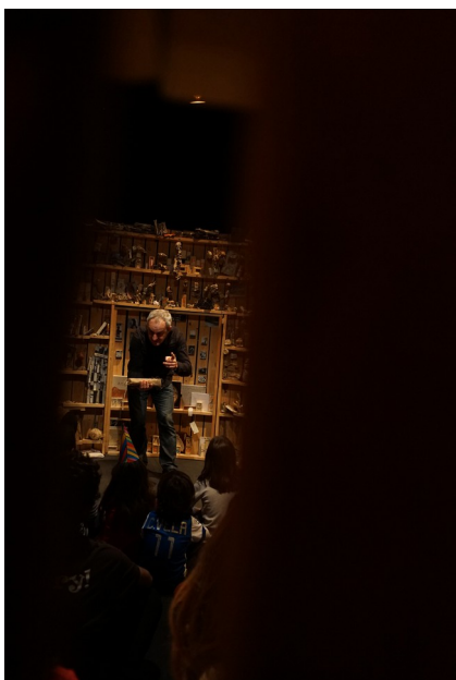
Teatre Lliure 2016