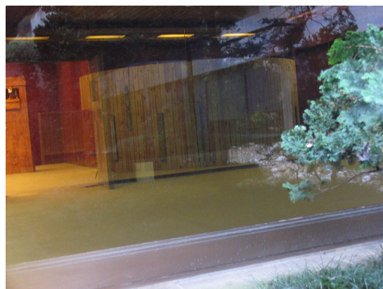
Alhondiga Bilbao 2015