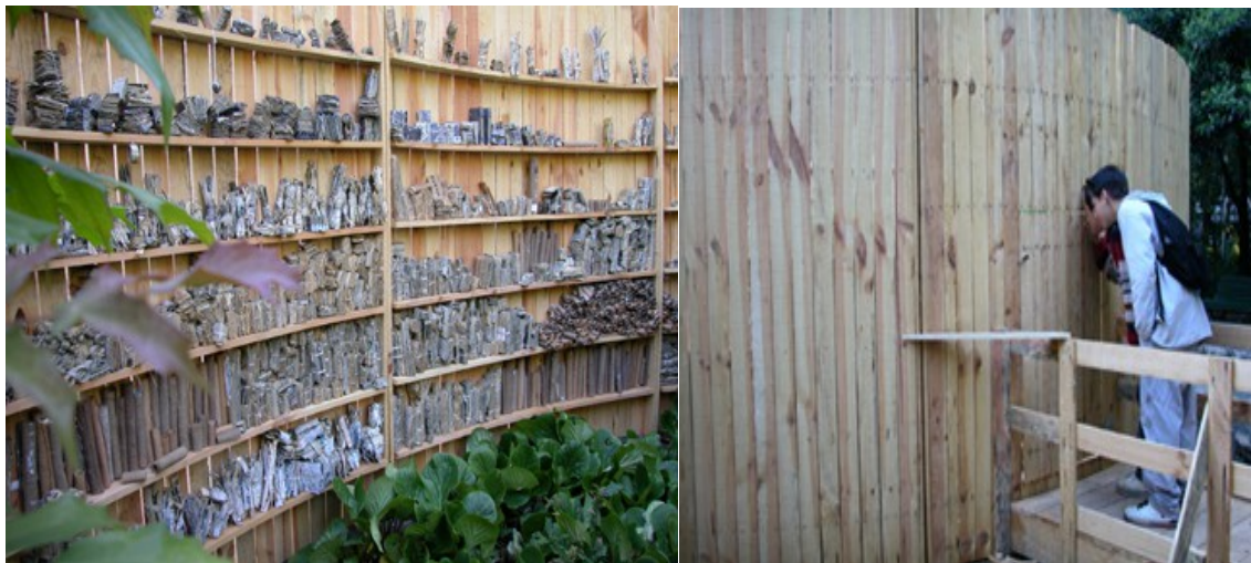
Biblioteca de cuerdas y nudos. Viseu 2003 Instalación. Parque Viseu 2003

Los fragmentos de vida fueron ampliando su contenido a medida que esta instalación fue mostrándose en ciudades como Evora, Pombal, Beja, Lisboa, Londres ( SBC Southbank – Royal Festival Hall ), Milán ( Teatro Piccolo di Milano / Teatro Strehler.Festival dei Bambini ), Madrid, Barcelona ( CCCB / MACBA ), Trento, Parma, Anvers y otras.