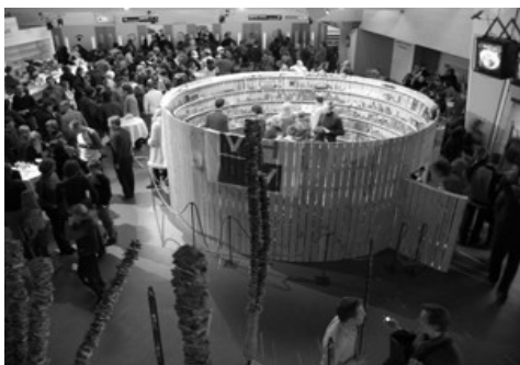
Biblioteca de cuerdas y nudos Anvers (Bélgica) 2005