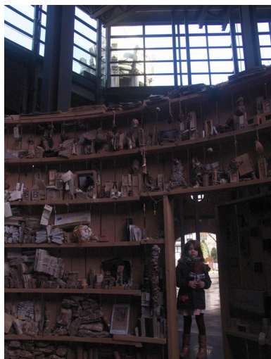
Fundação C. Gubelkian Lisboa 2006