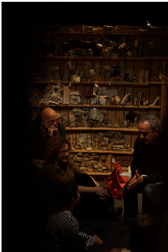
Teatre Lliure 2016