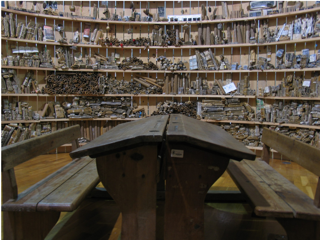
Biblioteca de cuerdas y nudos. Pombal (Portugal)

La búsqueda de pequeñas narraciones, la mayoría de veces apoyadas en pequeños objetos, señales dejadas por personas anónimas, artilugios, gestos o palabras, se convierten en el motivo central de este trabajo.