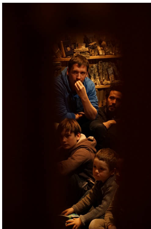
Teatre Lliure 2016

Dentro de la Biblioteca de cuerdas y nudos habitan diferentes proyectos y experiencias, que irán tejiéndose a través de la palabra y el silencio con una fuerte implicación del espectador. Durante 60 minutos iremos conociendo la vida experimentada de un maestro de escuela que intentó narrar el conocimiento y cuyo recuerdo todavía permanece en nosotros.