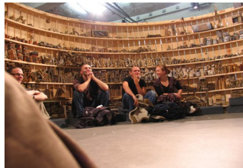
Biblioteca de conocimientos narrados Anvers (Bélgica) 2005